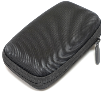
YSHIELD® Safe and Sound Pro II