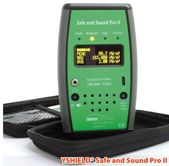
YSHIELD® Safe and Sound Pro II